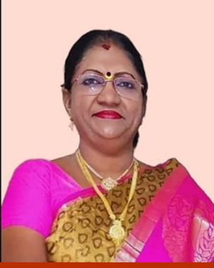
கவிஞர் உமா பாரதி