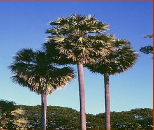
தமிழ் மாநில மரம் - பனை மரம்