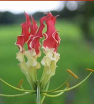
தமிழ்நாட்டின் மாநில மலர் - செங்காந்தள்