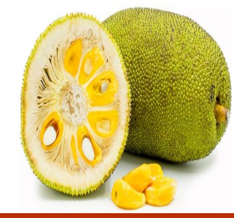
தமிழ் மாநில பழம் - பலாப்பழம் அறிவியல் பெயர் - Atrocarpus heterophyllus