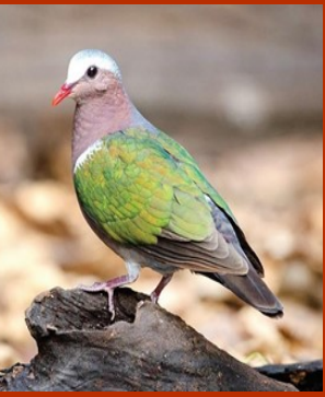
தமிழ்நாட்டின் மாநிலப்பறவை - மரகதப்புறா